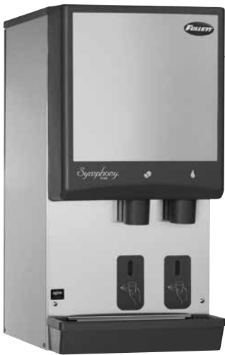
Mostrado con SensorSAFE™