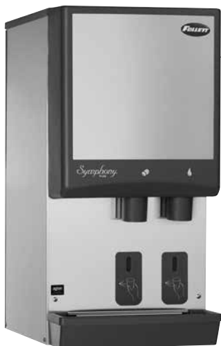
Mostrado con SensorSAFE™